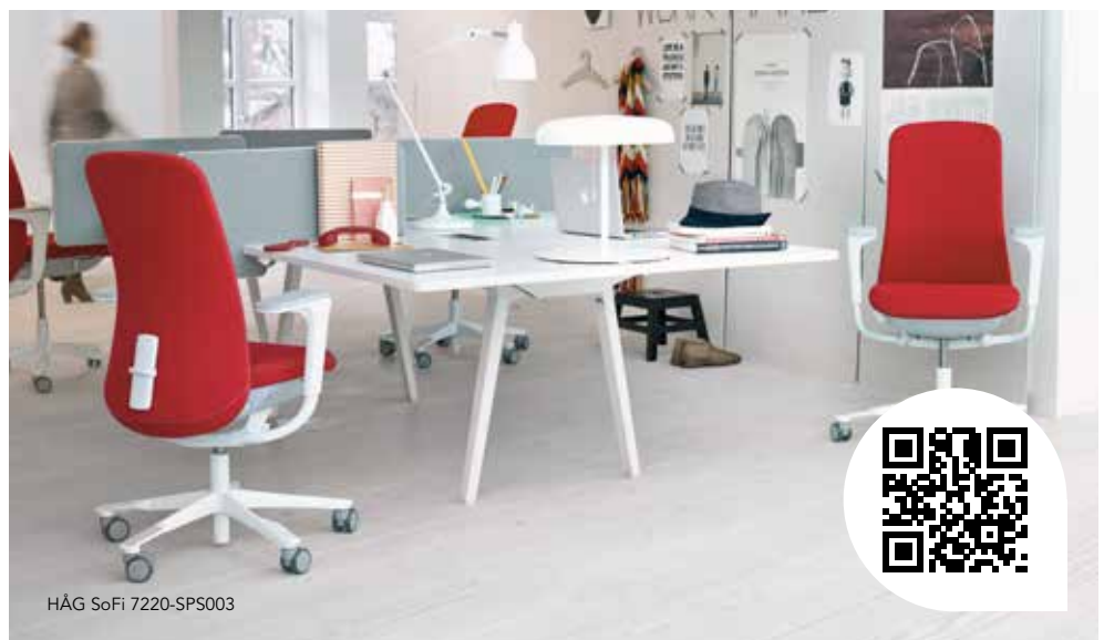
HÅG SoFi 7220-SPS003