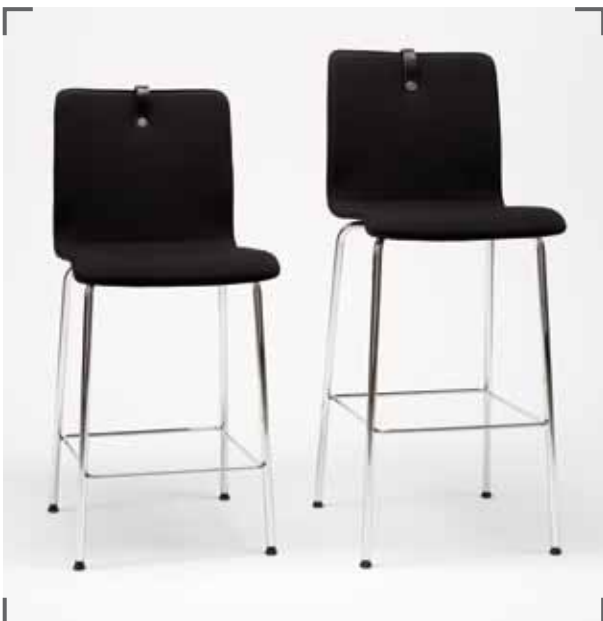
Barstuhl MESAMI 2 MM40, Barstuhl MESAMI 2 MM50 barchair MESAMI 2 MM40, barchair MESAMI 2 MM50 chaise de bar MESAMI 2 MM40, chaise de bar MESAMI 2 MM50