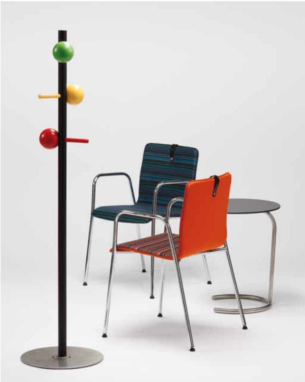
Garderobe HOLZER, Besucherstuhl MESAMI 2 MM11, Sattztisch HOLZER coatrack HOLZER, chair for visitirs MESAMI 2 MM11, gueridon HOLZER Portemanteau HOLZER, chaise visiteur MESAMI 2 MM11, table gigogne HOLZER