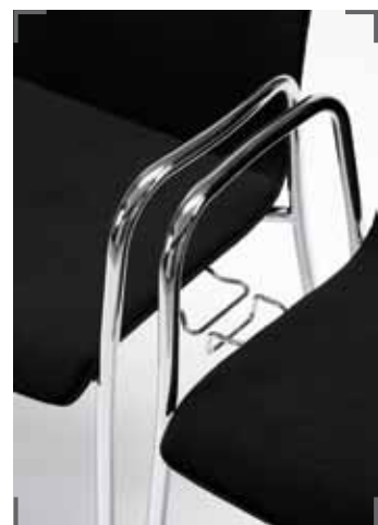
Reihenverbindung MESAMI 2 MM11 connection for row seating MESAMI 2 MM11 connexion chaise visiteur MESAMI 2 MM11